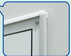
302-61 ☆ サイズ: 300×760×9mm 厚