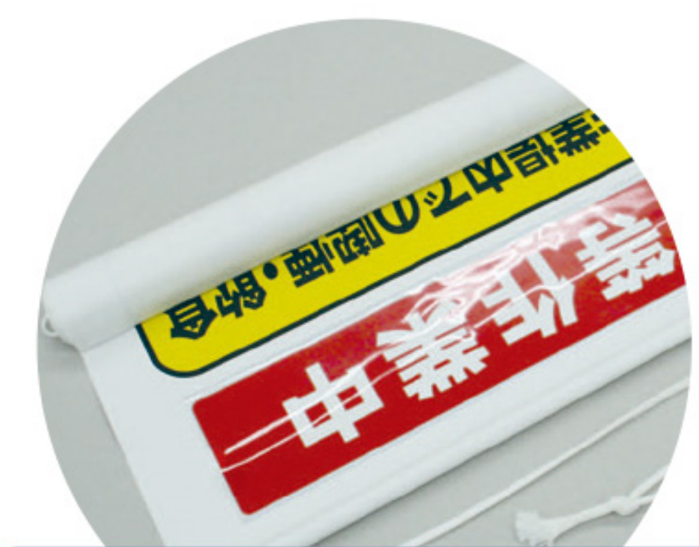
表 石綿封じ込め等作業中 ウラ 石綿除去作業中