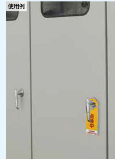
分電盤の ハンドルにも!